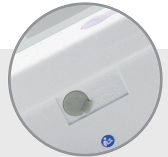
Toma de adaptador de corriente