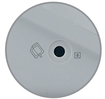
Entrada para Brazaletes